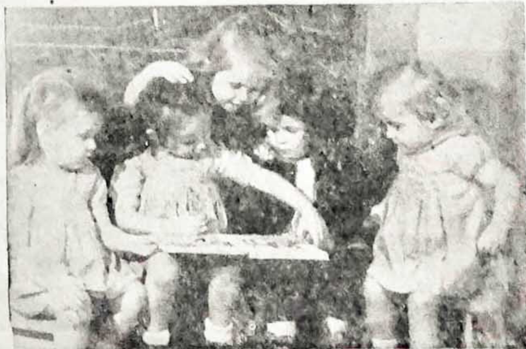
(D'après la Croix du Nord)