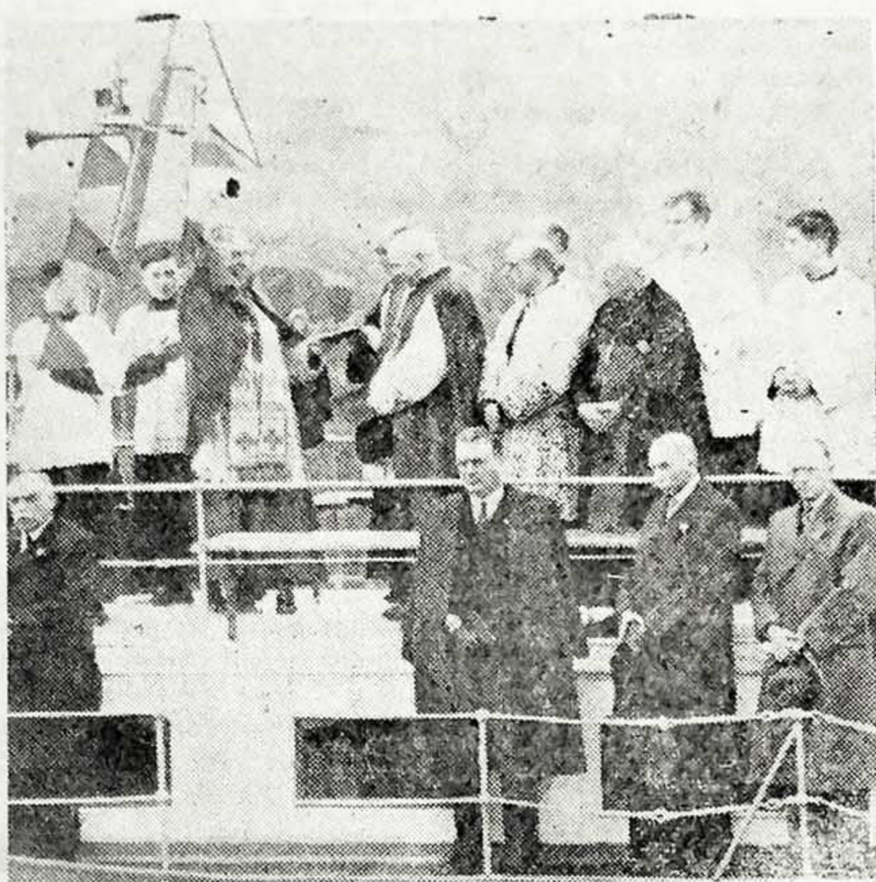
De la vedette de la Chambre de Commerce, S. Em. le Cardinal LIENART bénit le nouveau port.