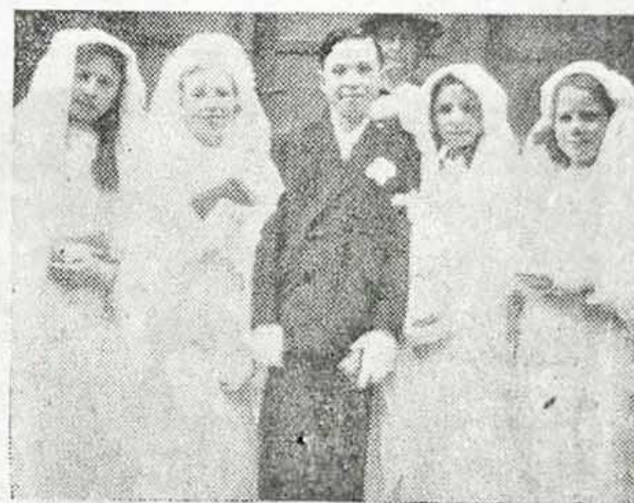
Lille, Groupe du 17 juin.