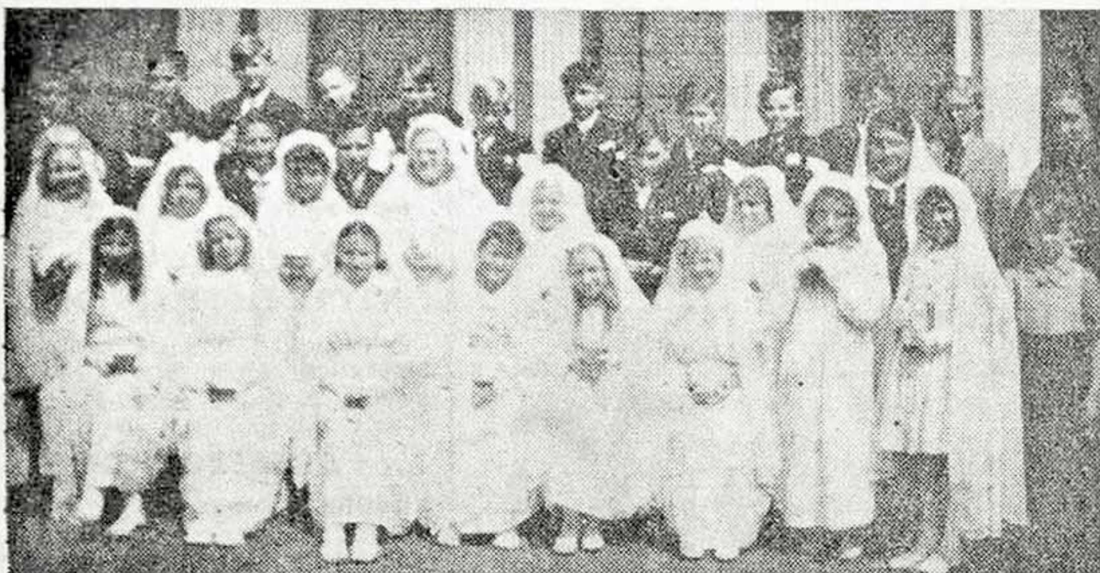
Lille, Groupe du 3 juin.